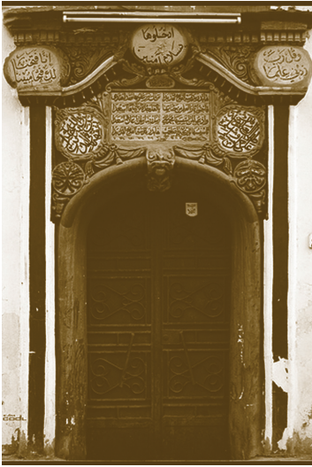
مدرسة الفلاح تأسست في مكة المكرمة سنة ١٣٢٠ هـ

إن من أقدم المدارس الحجازية النظامية المدرسة الصولتية ومدرسة الفلاح وكل منهما كانت تعنى بتدريس منهج أهل السنة والجماعة. ومن المتون التي اعتمد تدريسها في علم التوحيد في المدرسة الصولتية متن العقيدة السنوسية ومما جاء فيه: « مما يستحيل في حقه تعالى الماثلة للحوادث بأن يكون جرماً أي يأخذ ذاته العليُّ قدرًا من الفراغ أو يكون في جهة للجرم أو له هو جهة أو يتقيد بمكان وزمان».