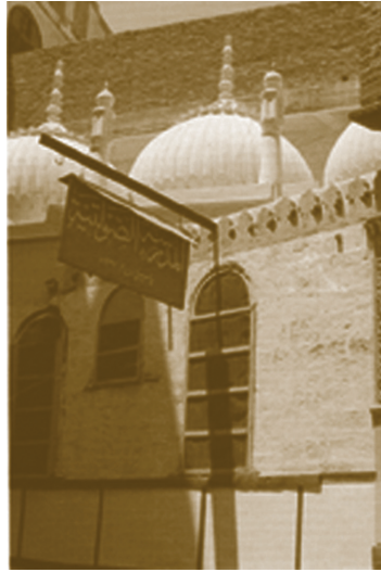
المدرسة الصولتية تأسست في مكة المكرمة سنة ١٢٩١ هـ