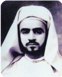
الشيخ المحدث عبد الله الغماري

قال الشيخ عبد الله الغماري محدث الديار المغربية أمام جمع من الناس في موسم الحج سنة ١٤١٠ هـ لما اجتمع بالشيخ محمد ياسين الفاداني ما نصه: «الشيخ محمد ياسين الفاداني هو مسند العصر بلا جدال» كما جاء في كتاب (تشنيف الأسع بشيوخ الإجازة والسع).